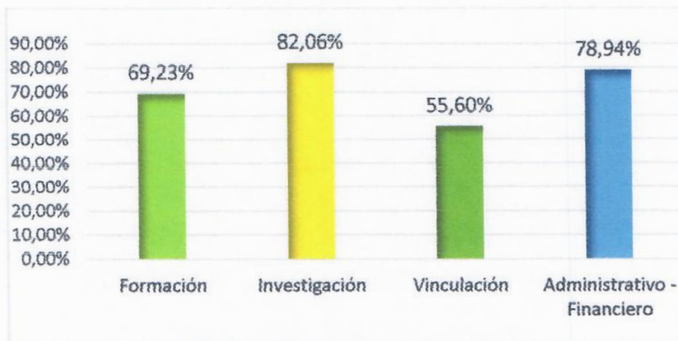
Gráfico 3: Resultados de metas de gestión por funciones sustantivas – Unidades Administrativas – Segundo Semestre 2018